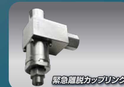
Hydrogen Break-away coupling