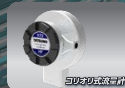
Coriolis Mass Flowmeter