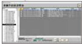
▲ 車輦予約状況照会明細画面

プリントされた配送先リストで、給油予定量とローリーのタンク残量を見ながら、急な注文や変更も確認しながら対応できます。