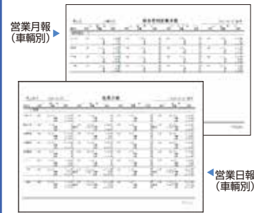
▲ 営業日報 (車輦別)