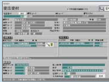
受注受け入力画面