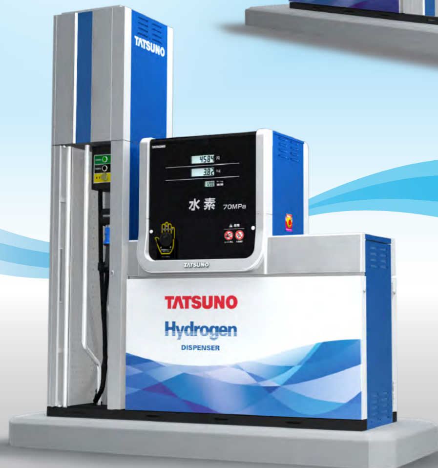
● Single side filling model