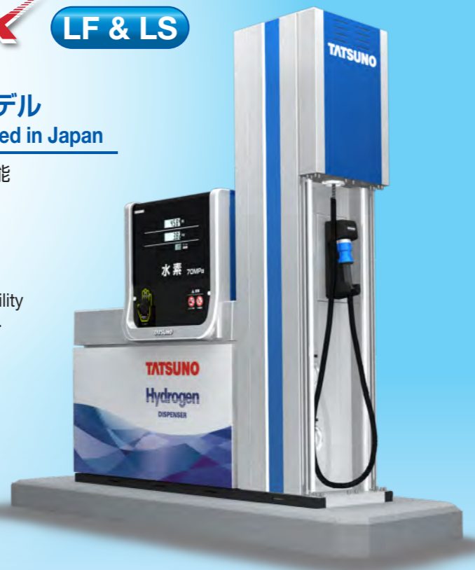
● Dual sides filling model