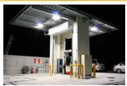
● 自家用給油所(物流関係)