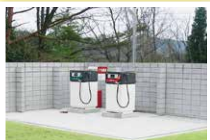
● 自家用給油所(ゴルフ場)