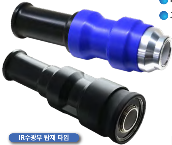
IR수광부 탑재 타입