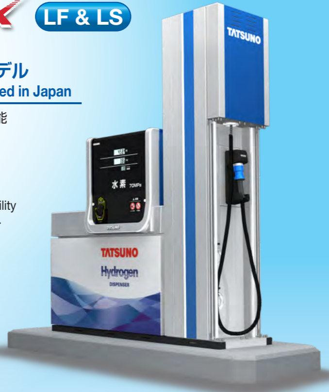
● Dual sides filling model